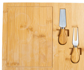
Tabla para Quesos Bambú

Bambú y acero inoxidable. Grabado láser.